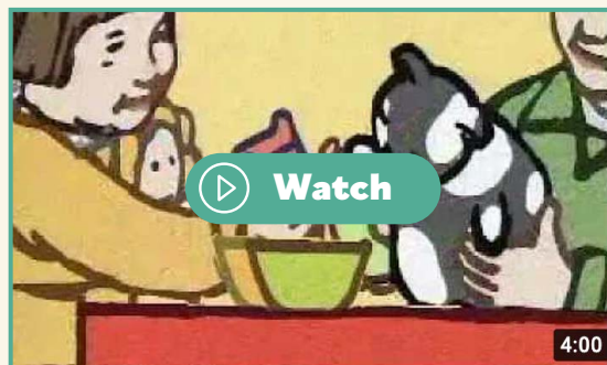
By E. Woloson and B. Gough